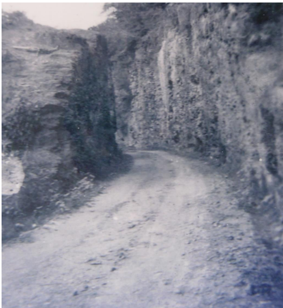
Imagem: Antigo caminho da Estrada de Ferro Bahia e Minas