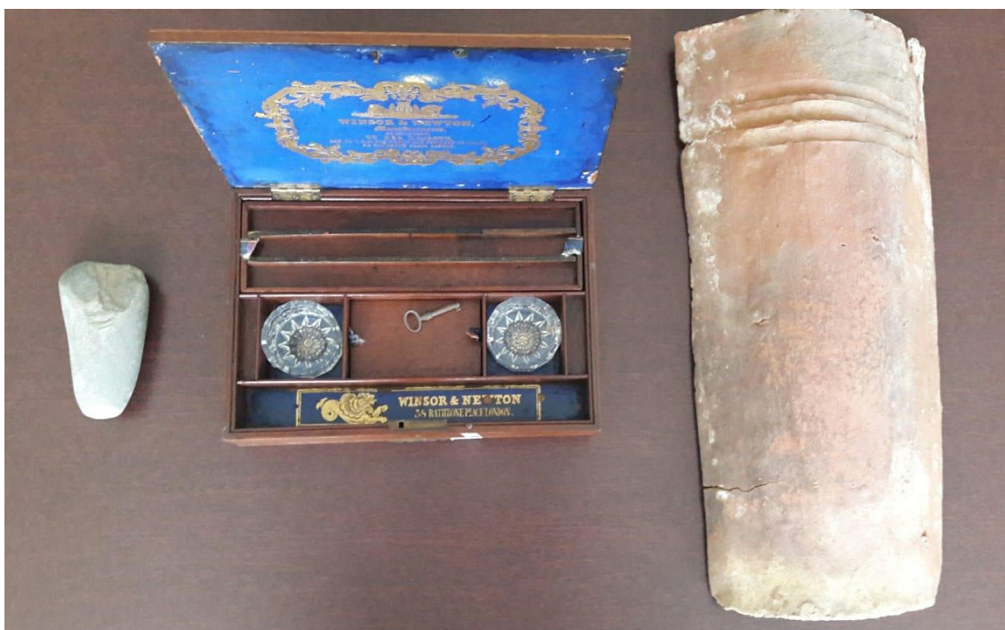
Imagem Márcio Achtschin: um artefato indígena encontrado no Mucuri, o estojo de pintura do alemão Albert Schirmer e uma telha da fazenda Monte Cristo fabricada por escravos.