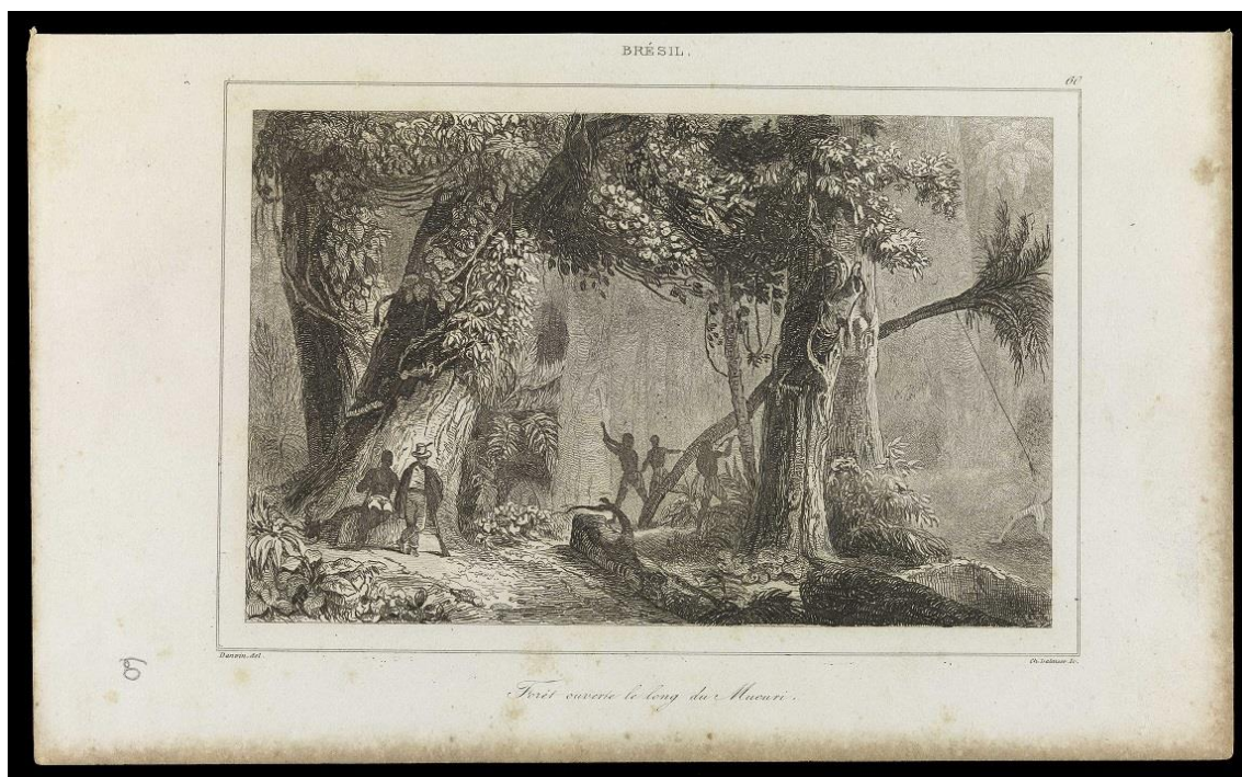
Foto: A mata do Mucuri

No século XIX foi determinante a presença do discurso civilizatório típico do neocolonialismo ocidental, influenciando de forma direta o modelo de ocupação predatória no Mucuri. Nele, os indígenas e a mata seriam um impedimento para o progresso, devendo, portanto, serem eliminados. O controle do território brasileiro era essencial para consolidar o poderio do recém formado Império. O nordeste mineiro era espaço onde, apesar do esforço, o Estado pouco alcançava. Partilhando com valores oitocentistas, o governo assumiu uma política de ocupações das regiões de matas, vista como um impedimento à saga civilizatória. Somada a essa realidade global e nacional, Minas Gerais vai superar a crise da mineração com um alto grau de mercantilização e o seu nível de desenvolvimento se entrelaça com bases produtivas diferenciadas e em dinâmicas particularizadas. A ocupação no Vale do Mucuri esteve associada ao crescimento populacional da província mineira no século XIX, que vai transpor os limites das áreas mineradoras, originando novos espaços habitados. Em busca de espaços agricultáveis, quer seja para abastecimento local, quer seja para exportação.