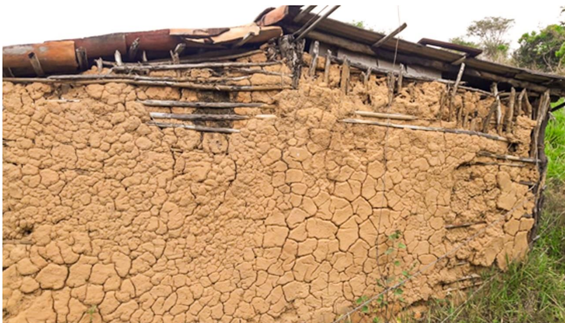
Imagem: Márcio Achtschin Santos