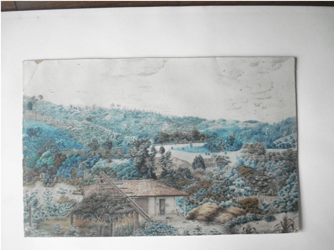
Imagem: Fazenda Itamunhec, produtora de café, que usou o trabalho escravo em larga escala, pintura Albert Schirmer do século XIX

Mesmo com o fim da Companhia, o deslocamento da fronteira agrícola em direção ao Mucuri se manteve. Um movimento autônomo, silencioso, que no próprio espaço mineiro buscou alternativa de produção. Paralelo à produção voltada para um mercado local surgiu também, gradativamente, uma agricultura de exportação que ganhou força, especialmente no plantio do café. O plantio do café se estabeleceu ao longo da segunda metade dos anos de mil e oitocentos e foi determinante para formação da sociedade regional. De 480 toneladas produzidos na safra de 1878, a produção regional saltou para 3 mil toneladas em 1896. Isso explica os investimentos do governo da província mineira na região a partir da década de 80 do século XIX, em especial a Estrada de Ferro Bahia e Minas (EFBM). A produção nas fazendas se baseou até 1888 a partir do trabalho escravo e depois dessa data predominou o trabalho agrego. Em 1930, o Mucuri era a segunda maior produção de Minas Gerais. A crise de 1929 alterou profundamente esse quadro.